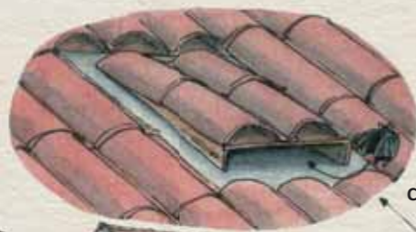
CHIROPTIÈRE EN TOITURE