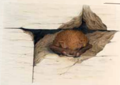
Murin à oreilles échancrées

Pas besoin de grands espaces pour certaines espèces comme les Pipistrelles ou les Sérotines qui se contentent de volets ouverts, d'espaces restreints sous les tuiles, des rampants ou des combles.