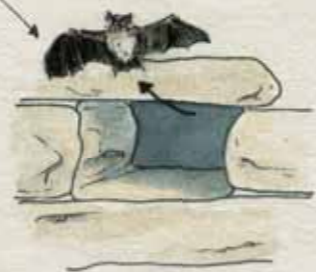
ACCÈS AUX CAVES ET GRENIERS