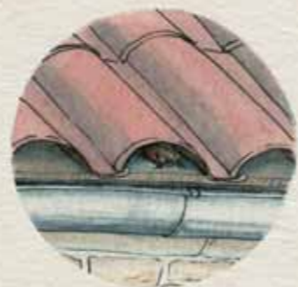
SOUS LES TUILES