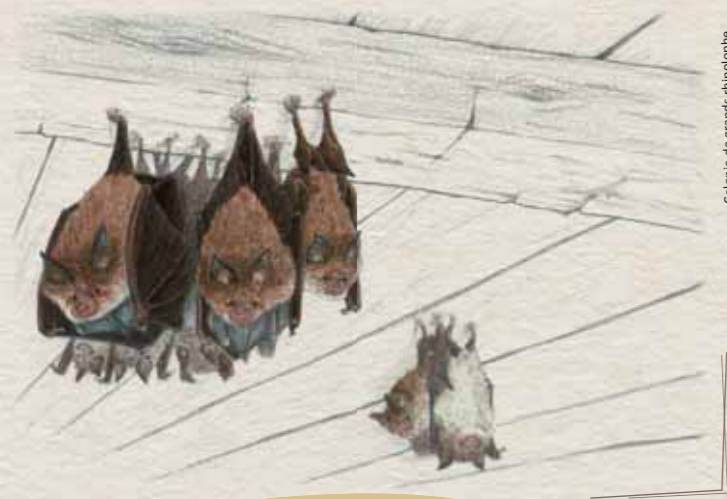
Colonie de grands rhinolophe