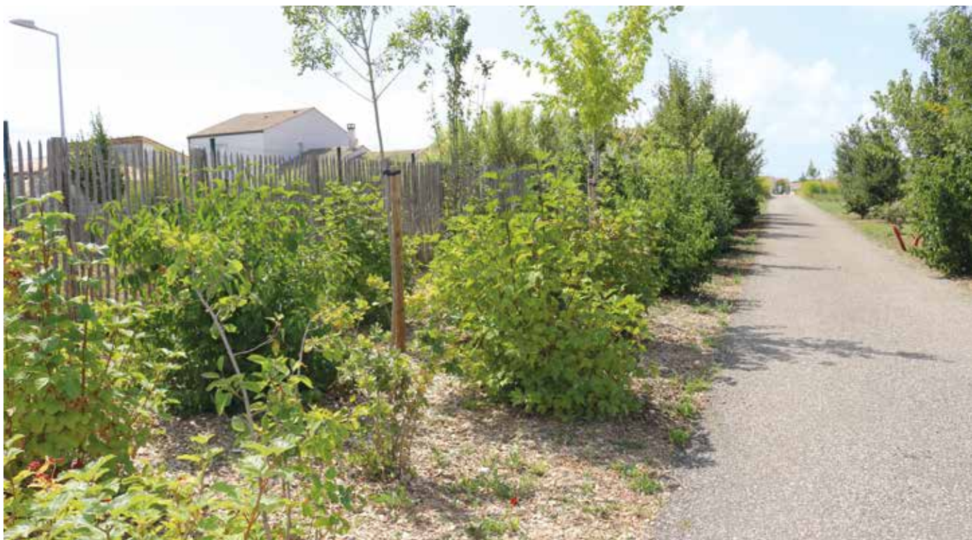
Léco-quartier de la Marquina à Marennes, une nouvelle façon d'aménager.

Le Schéma de Cohérence Territoriale (SCoT) est en cours de révision. L'occasion pour les élus et les habitants de définir la stratégie d'aménagement du territoire pour les vingt prochaines années, avec un enjeu de taille: nous adapter au dérèglement climatique.