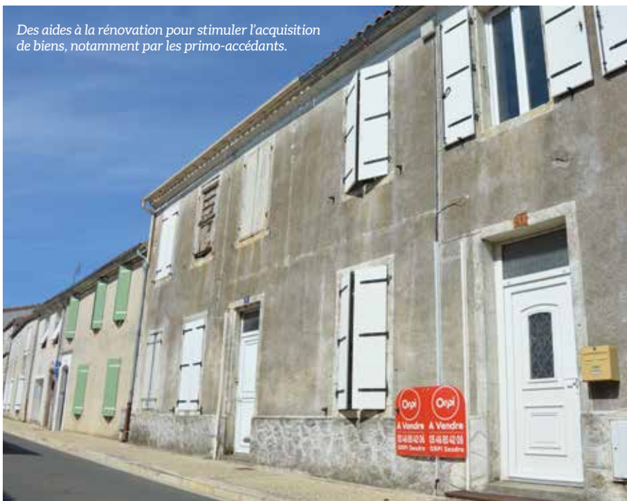
Des aides à la rénovation pour stimuler l'acquisition de biens, notamment par les primo-accédants.