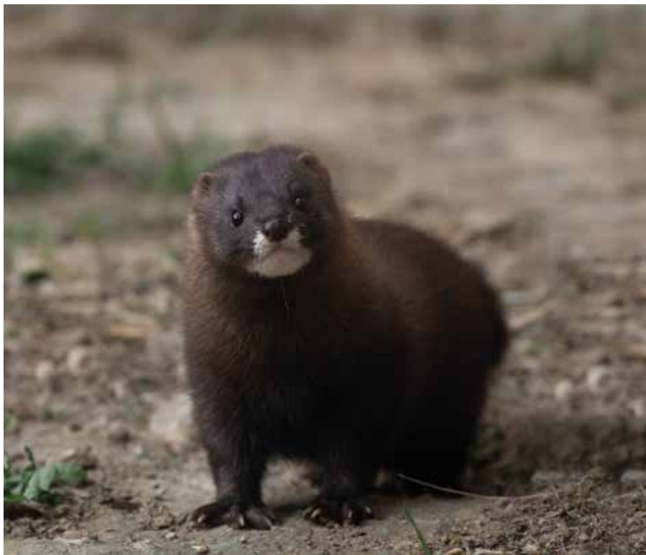
Le Vison d'Europe est reconnaissable par sa tâche blanche autour des lèvres.

Le service Natura 2000 de la CdC lance une vaste opération de détection du Vison d'Europe sur le marais de Brouage. L'objectif: vérifier la présence de cette espèce protégée en voie d'extinction et si, tel est le cas, prendre en compte sa préservation dans la gestion du marais.