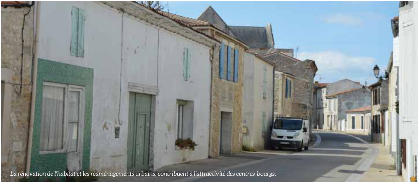
La rénovation de l'habitat et les réaménagements urbains, contribuent à l'attractivité des centres-bourgs.

La Communauté de Communes et les six Communes du Bassin de Marennes lancent un important programme d'aides à la rénovation, avec notamment comme objectif de produire de nouveaux logements afin de revitaliser les centres-bourgs. 8,5 millions d'euros seront mobilisés sur cinq ans.