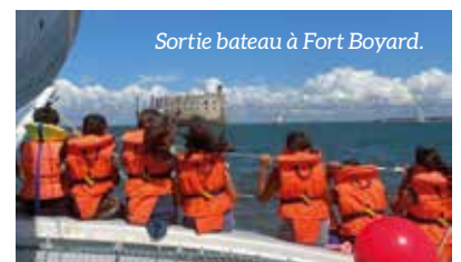
Sortie bateau à Fort Boyard.