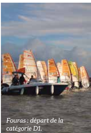
Fouras : départ de la catégorie D1.

Nul doute que les CNPistes porteront haut les couleurs du Bassin de Marennes !