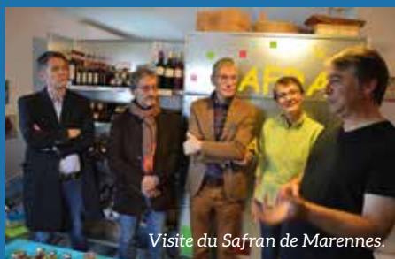
Visite du Safran de Marennes.