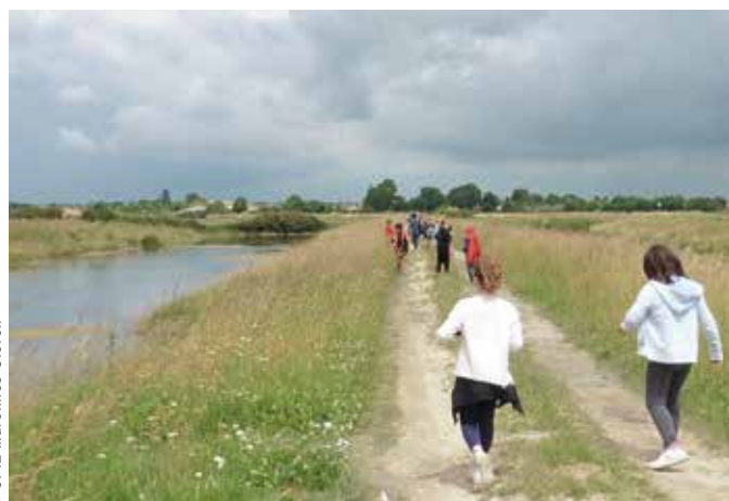
Sortie des élèves de Nieulle-sur-Seudre au cœur du marais.

La CdC du Bassin de Marennes et l'Agglomération Rochefort Océan ont lancé un programme pédagogique de sensibilisation à destination des élèves du territoire, afin de leur faire découvrir les spécificités du marais.