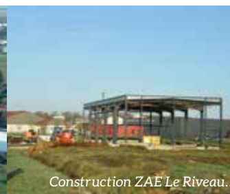
Construction ZAE Le Riveau.