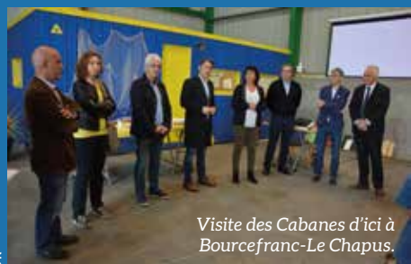
Visite des Cabanes d'ici à Bourcefranc-Le Chapus.

Les élus et le service Développement économique de la CdC vont régulièrement à la rencontre d'entrepreneurs afin de découvrir leurs activités et d'échanger sur leurs éventuelles attentes ou contraintes. Organisées en présence des partenaires économiques locaux, ces visites permettent aussi de présenter les différents acteurs à même d'accompagner les entrepreneurs dans leurs projets.