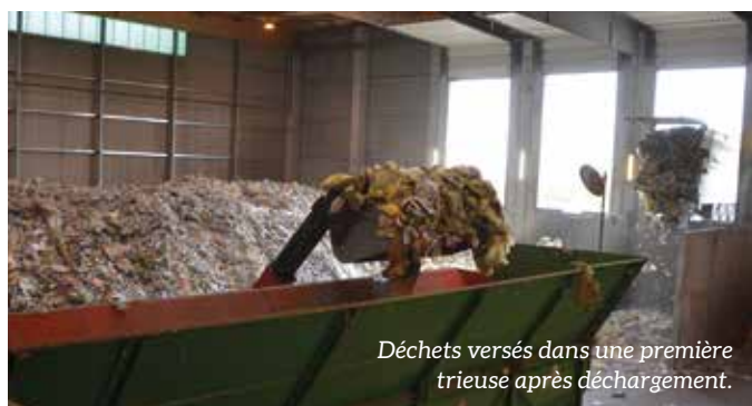
Déchets versés dans une première trieuse après déchargement.

Il dispose de 14 flux de tri correspondant à 14 types de déchets, dont 6 flux pour les différents plastiques. Il est équipé des dernières technologies en matière de tri, avec notamment 7 trieurs optiques, 4 séparateurs dont 1 à champ magnétique, 2 presses à balles. Les machines ne faisant pas tout, 14 trieurs affinent le tri en fin de chaîne.