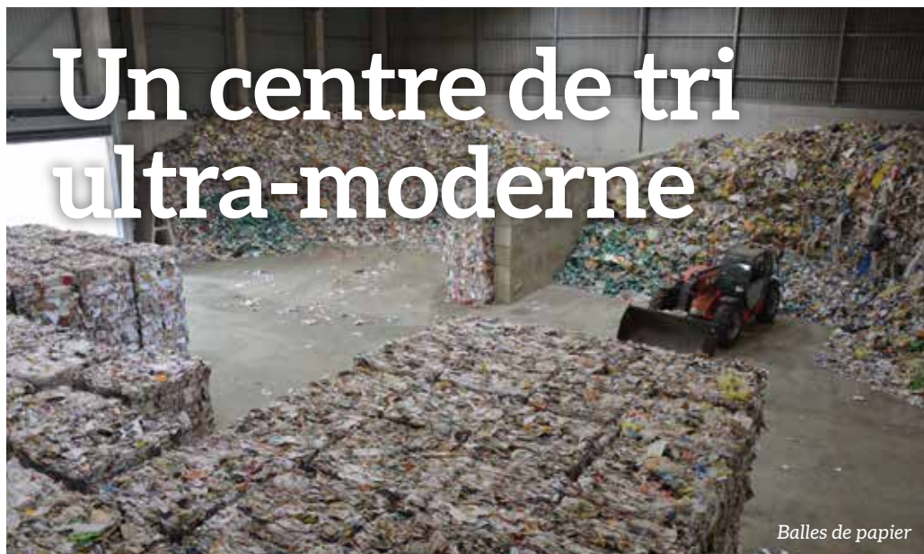
Balles de papier

Les déchets que vous triez sont envoyés vers le centre de tri Atrion, situé à Mornac en Charente, pour être à nouveau triés avant d'être revalorisés pour la plupart.