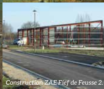
Construction ZAE Fief de Feusse 2.

L'année 2018 a vu l'extension ou l'aménagement de trois Zones d'Activités Économiques (ZAE) sur le Bassin de Marennes. C'est le résultat de plusieurs années de travail, qui va porter ses fruits à partir de 2019 avec l'installation d'une trentaine d'entreprises.