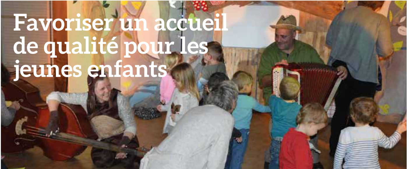
Animation de Noël pour les enfants et les assistantes maternelles.

En étoffant son service dédié à la petite enfance, le CIAS du Bassin de Marennes propose de nouvelles permanences pour répondre aux questions des parents. Il développe également ses animations à destination des assistantes maternelles afin de les accompagner dans leurs pratiques professionnelles.