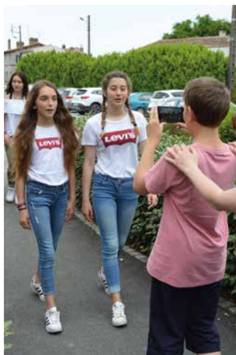
Tournage du clip sur téléphone portable.

Durant le mois de mai, les adolescents ont tourné un clip vidéo avec une animatrice de l'association Hors Champs de Niort. À l'origine du projet : la perspective d'aller voir Bigflo et