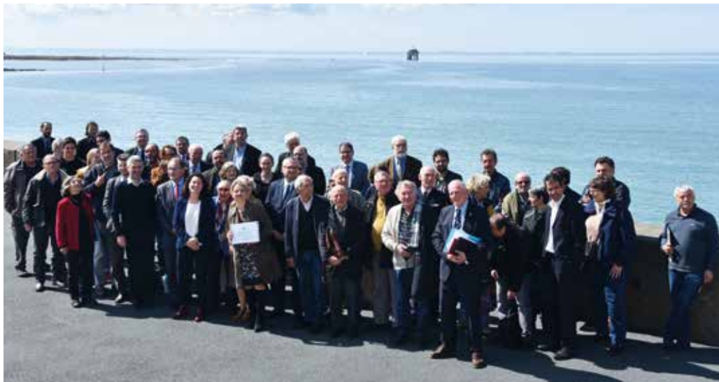
Le conseil de gestion réuni le 13 avril.